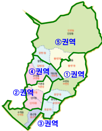
[ 권역별 참여기관 ]